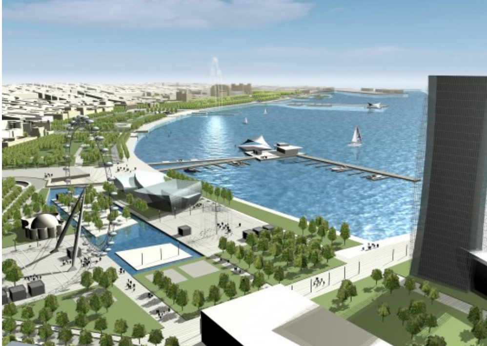
Propuesta © as-p